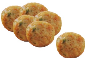
Albondigas (Hackfleischkügelchen) mit pikanter Sauce