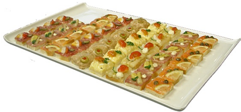
¼ Canapées gemischt